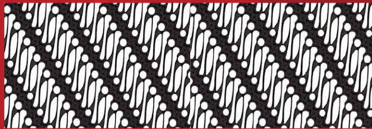
Batik Parang Lereng

Jubah selendang yang mengadopsi seperti superhero "Superman" yang mengartikan sebagai karakter kuat pemberani dan didukung juga warna merah yang artinya juga sama kuat dan pemberani. Serta warna hijau yang mengartikan ketenangan.