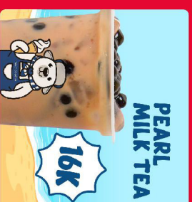
PEARL MILK TEA