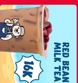
RED BEAN MILK TEA