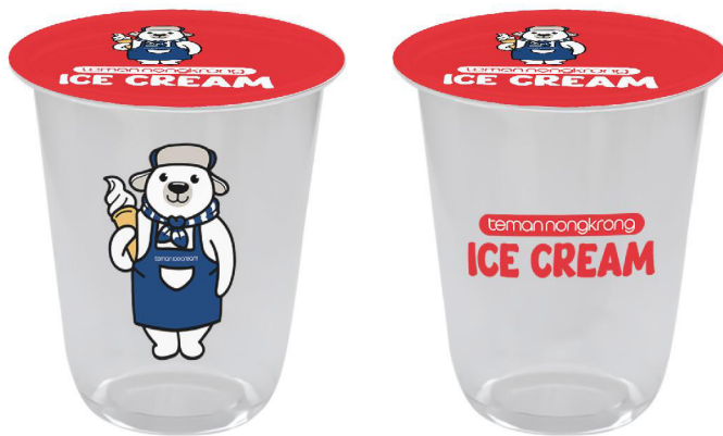
PLASTIK CUP ICE