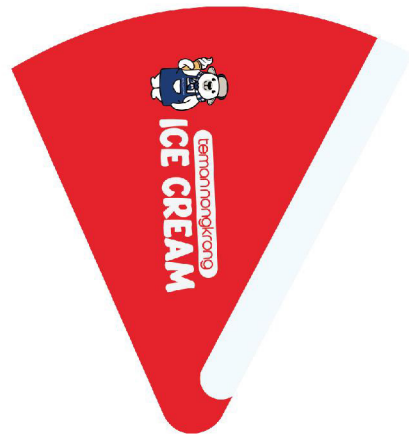
WARAPPING ICE CREAM