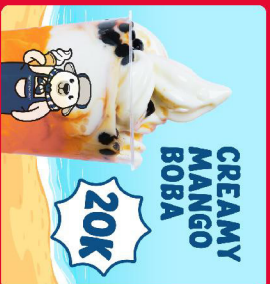
CREAMY MANGO BOBA