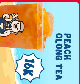
PEACH OLONG TEA